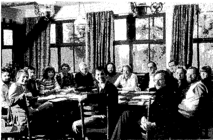
De eerste vergadering van het international council van Christian Artists in 1980